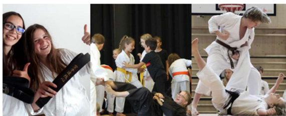
Fotomontage: Karate-Do Sanchin

Honbu Dojo Karate-Do Sanchin Schwarzseestrasse 60a 1712 Tafers