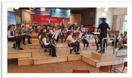
Jugendmusik St. Antoni