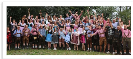
Musikgesellschaft St. Antoni