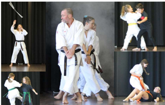
Fotomontage: Karate-Do Sanchin

Einstieg jederzeit möglich, unverbindliche Schnupperkurse am